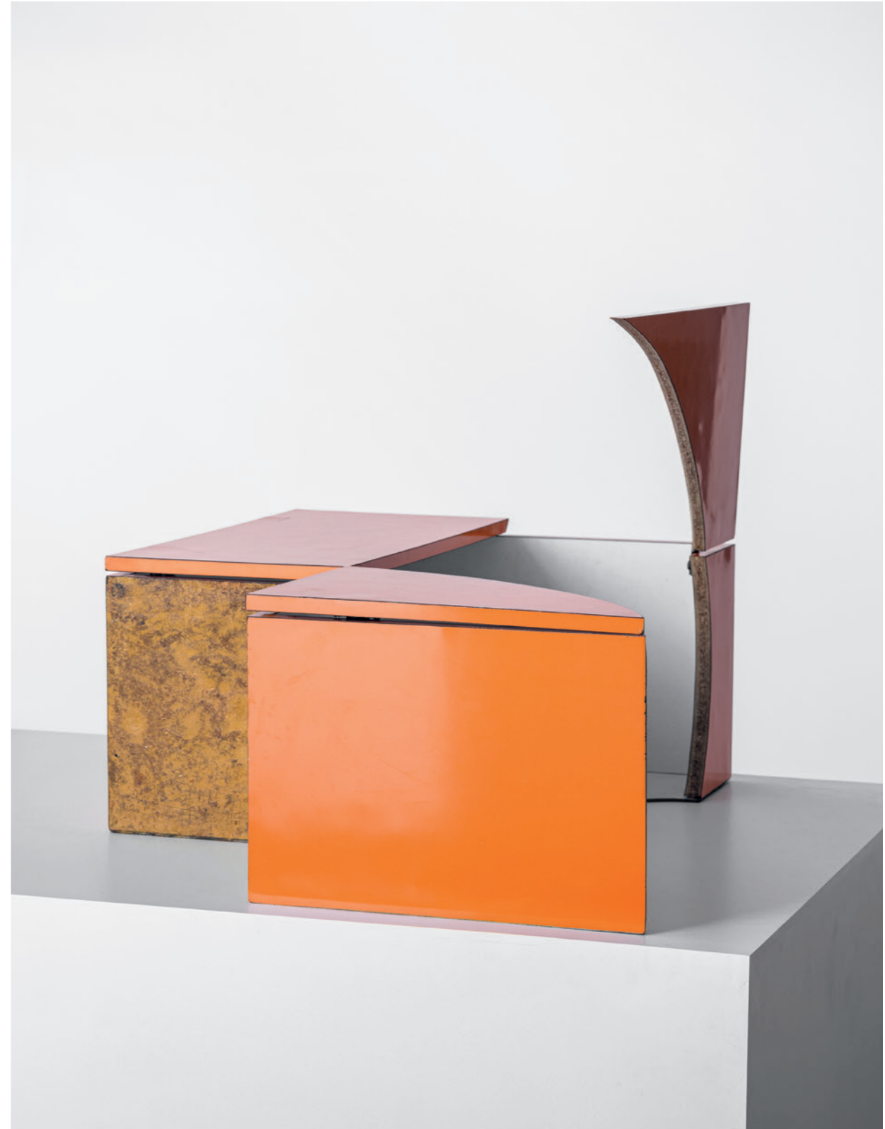
MARCELA SINCLAIR Bicho 1 , 2012 Alacena intervenida, bisagras / Intervened cupboard, hinges Medidas variables / Dimensions variable