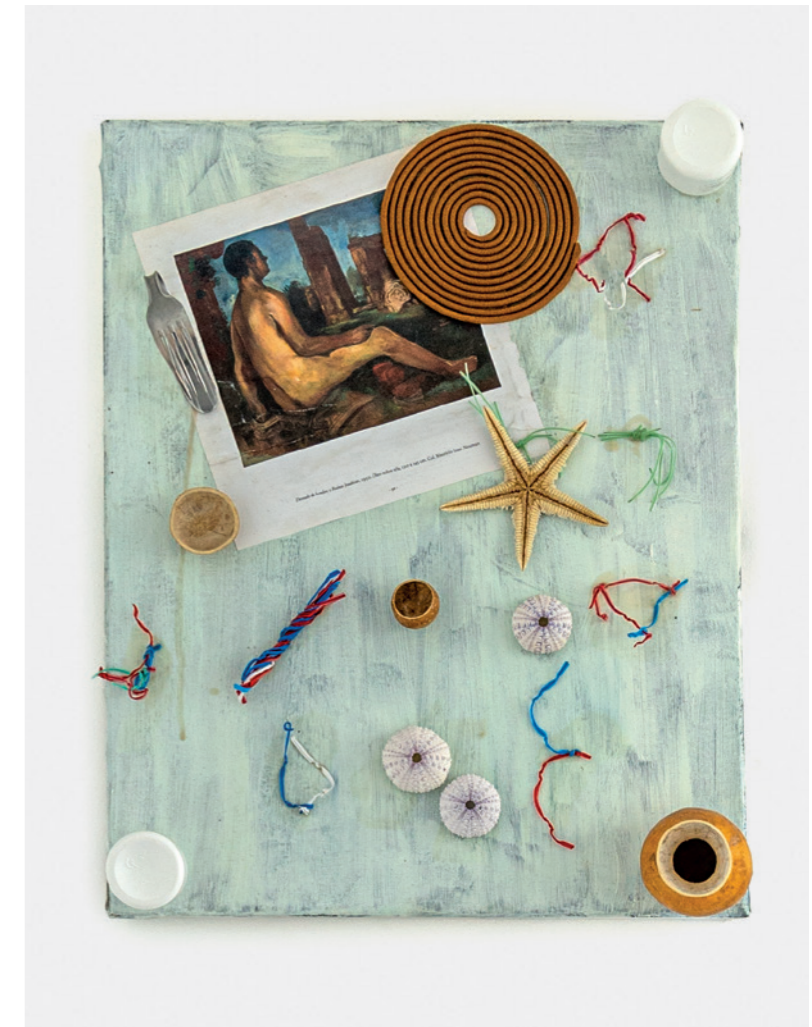
SANTIAGO VILLANUEVA Paradiso , 2023. Collage 50 x 40 cm