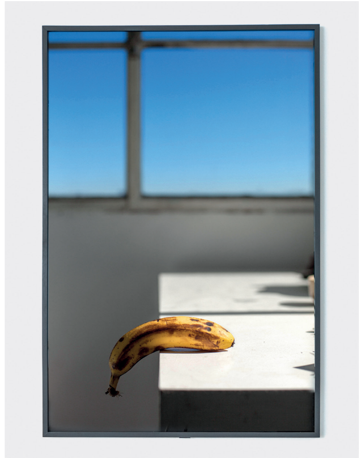
IGNACIO IASPARRA Paramnesia , 2020. Fotografía digital, roma directa, impresión giclée / Digital photography, direct shot, giclée print, 150 x 100 cm