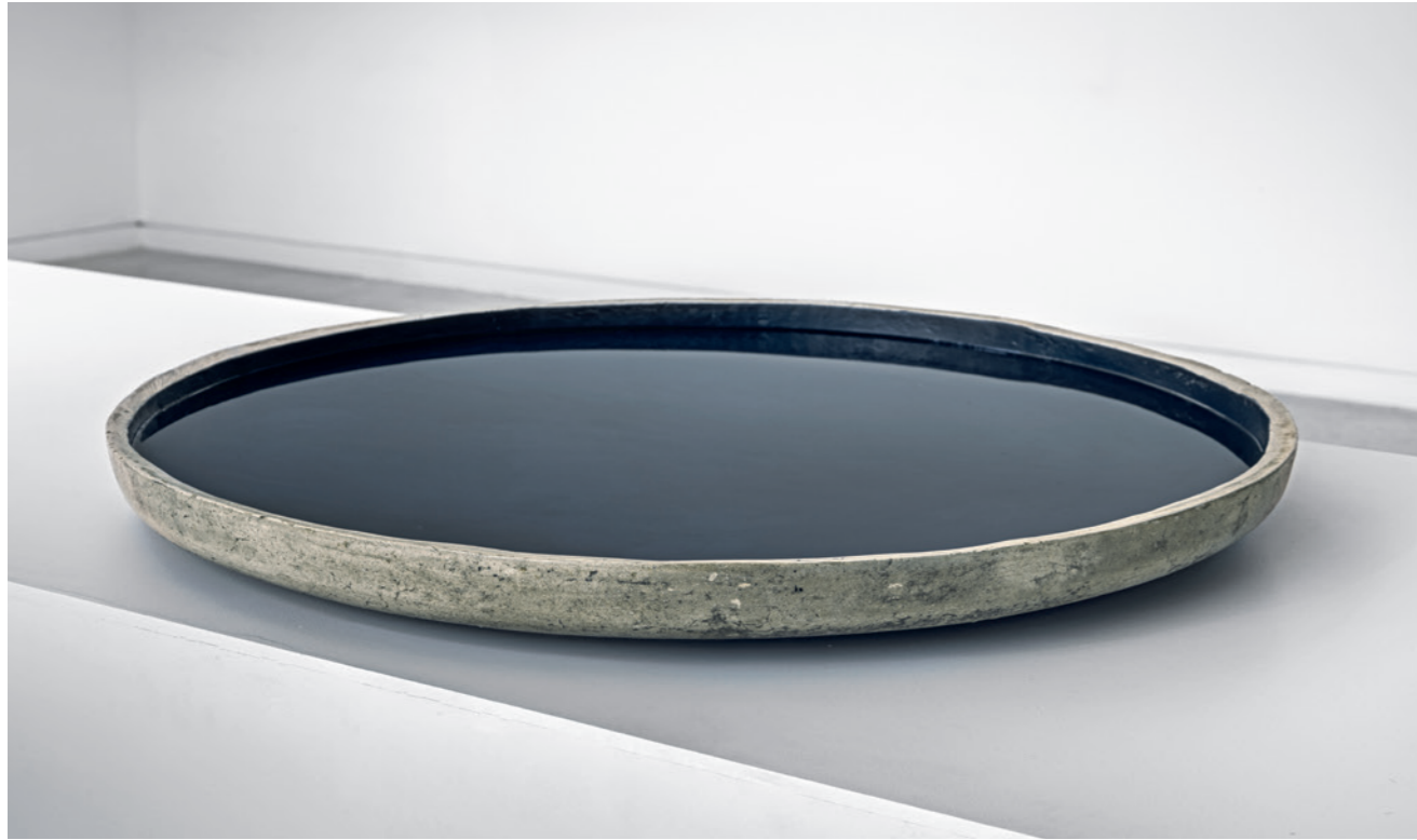
IUMI KATAOKA Yves o la superficie , 2015 Fibra de cemento, pintura, agua, base de hierro / Fiber cement, paint, water, iron base. Diámetro / Diameter 100 cm