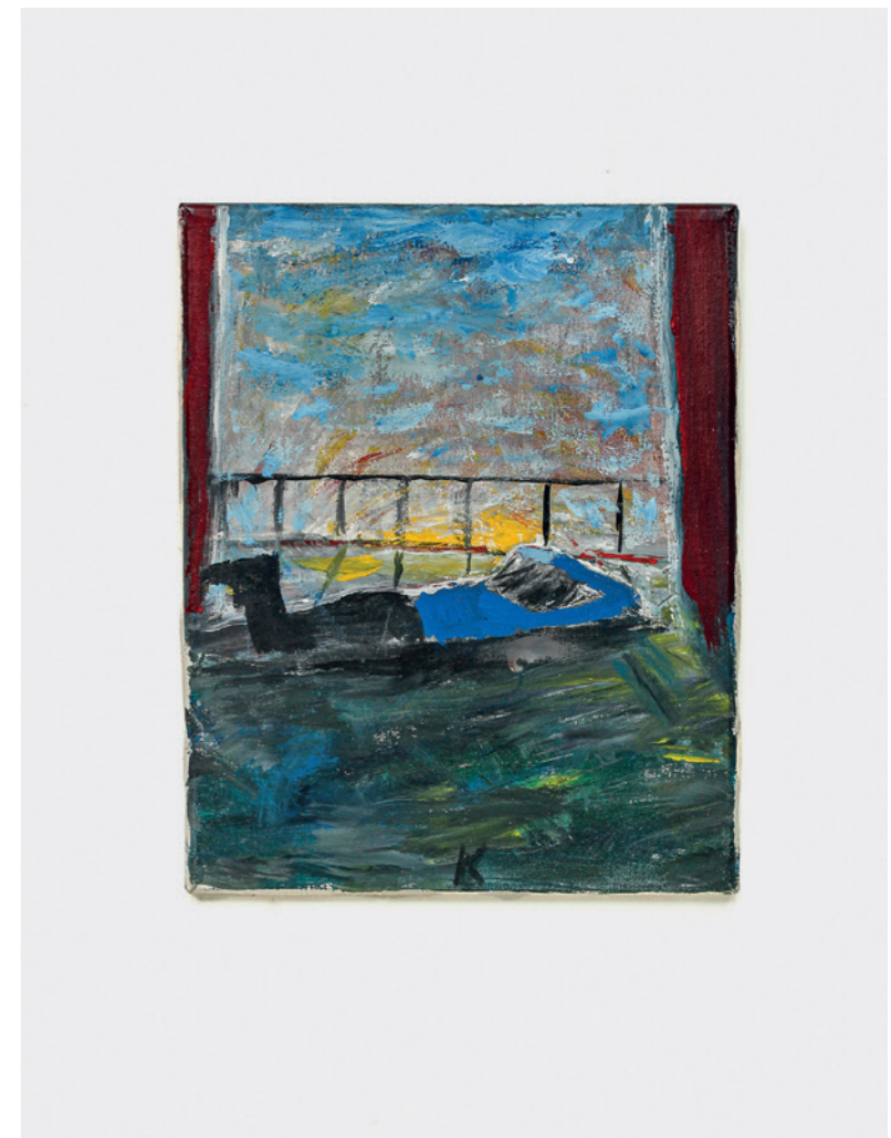
GUILLERMO KUITCA Sin ríulo , 1984 Acrílico y loxon sobre rela / Acrylic and Loxon on canvas 30 x 24 cm