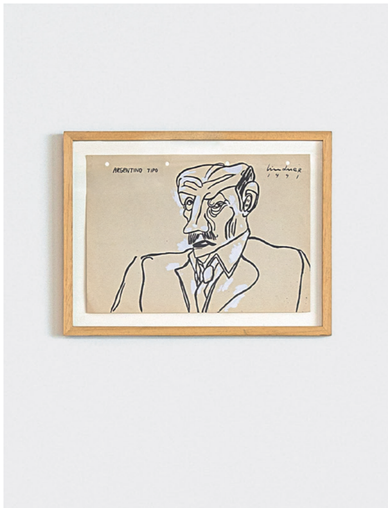
LUX LINDNER Argentino tipo , 1991 Tinta china y acrílico sobre papel / India ink and acrylic on paper 21 x 29 cm